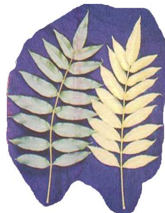
Folhas compostas imparipenadas, com até 13 pares de folíolos lanceolados